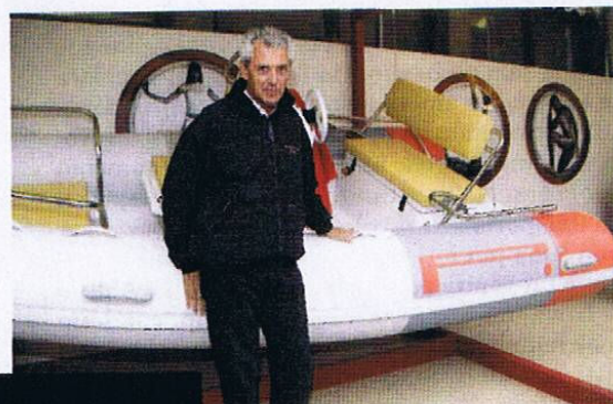
Sopra, Marco Tronchetti Provera durante la presentazione dei gommoni in occasione del Trofeo Pirelli a Santa Margherita Ligure.

Dopo più di 50 anni dall'esordio nella nautica, il gruppo italiano conia Pzero, una nuova linea di gommoni. Sono costruiti da Tecnorib.